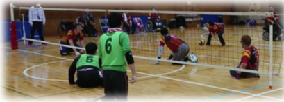
【出典】東京都ローリングバレーボール連盟

ローリングバレーボールとは、名前の通り、「玉を転がす」バレーボール。バレーボール用ネットを床から 30~35cm までの高さに設置し、その下をボールを転がして行うスポーツです。原則として障害のある方4名以上、健常者2名以下のプレーヤーで行います。